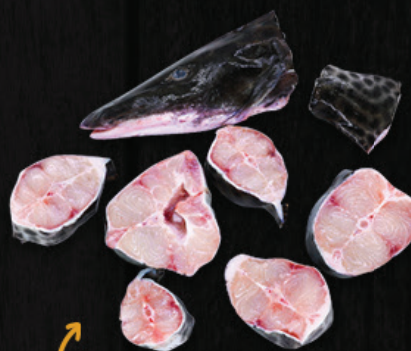
POSTA E CABEÇA DE PINTADO