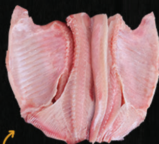
TAMBATINGA ESPALMADA SEM CABEÇA SEM ESCAMA SEM ESPINHA