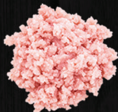
CARNE MOÍDA DE TAMBATINGA