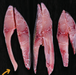
POSTA SEM CABEÇA DE TAMBATINGA (COSTELINHA)