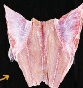
PINTADO ESPALMADO COM PELE