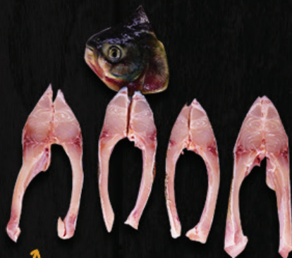
POSTA E CABEÇA DE TAMBATINGA EM PEDAÇOS