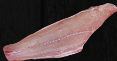
FILÉ DE PINTADO DA AMAZÔNIA INTEIRO SEM PELE