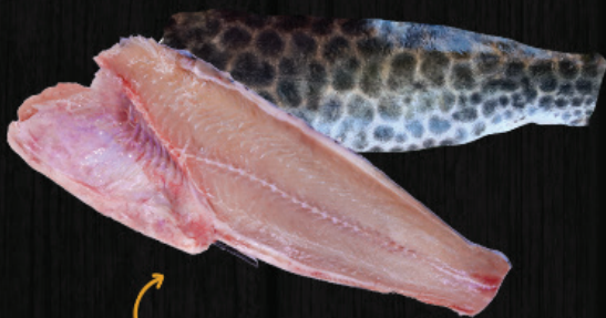
BANDA DO PINTADO COM PELE