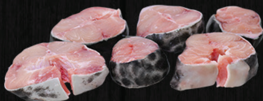
POSTA SEM CABEÇA DE PINTADO