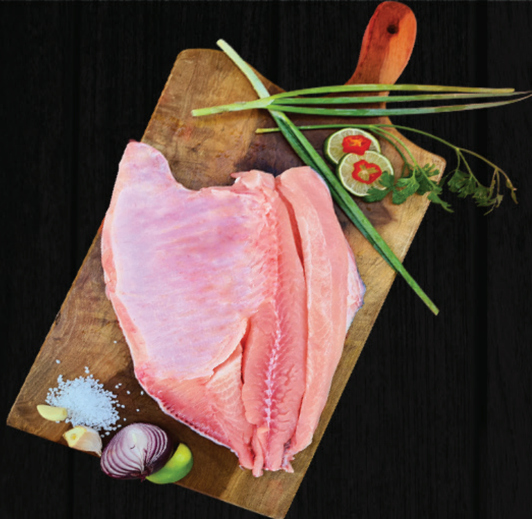
BANDA TAMBATINGA SEM ESCAMA SEM ESPINHA