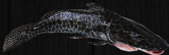
PINTADO DA AMAZÔNIA INTEIRO EVISGERADO

Apreciado por sua carne muito saborosa, macia e não contém espinha.