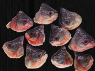
CABEÇA DE TAMBATINGA