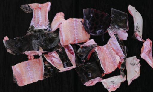
SUÃ E CABEÇA DE PINTADO