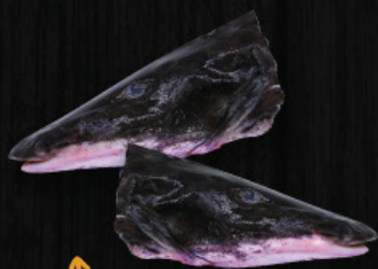
CABEÇA DE PINTADO DA AMAZÔNIA