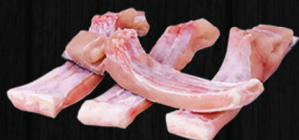
VENTRECHA FINA TAMBATINGA SEM ESPINHA