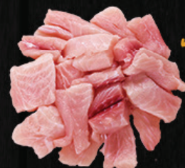
ISCA / FILÉ DE TAMBATINGA EM PEDAÇOS SEM PELE