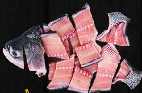
CABEÇA E ESPINHAÇO DE TAMBATINGA (SUÃ)