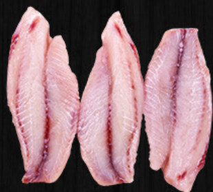
FILÉ DE TILÁPIA SEM PELE