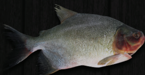
TAMBATINGA EVisCERADA SEM ESCAMA COM ESPINHA

Uma nova espécie com melhores características, mais vigor e mais resistência à doenças, produzindo uma carne de melhor qualidade.