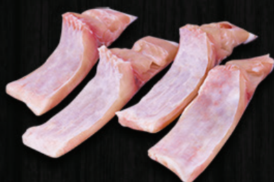
VENTRECHA LARGA TAMBATINGA SEM ESPINHA