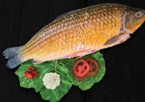
PIAÇU EVISCERADO SEM ESCAMAS COM ESPINHA